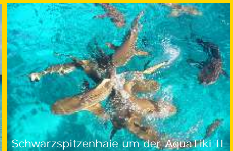
Schwarzspitzenhaie um der AquaTiki II