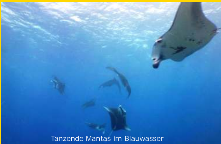
Tanzende Mantas im Blauwasser

Überfahrt nachts, nach dem letzten Tauchgang in ca. 11 Std. nach Makemo.