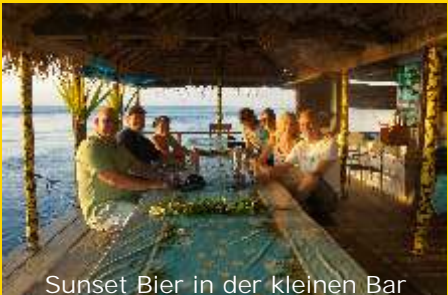
Sunset Bier in der kleinen Bar