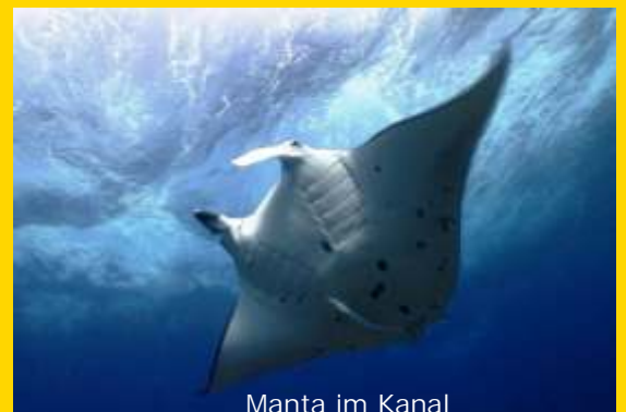
Manta im Kanal