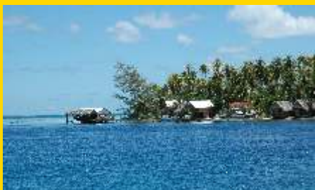
Te Ta Manu im Süden von Fakarava

das zweitgrößte Atoll Französisch Polynesiens, ist ein 60 km langes und 25 km breites Rechteck mit zwei Hauptdörfern: Rotoava im Nordosten an der 1 km breiten nördlichen Riffpassage Ngarue, und Tetamanu, das an der südlichen schmalen Riffpassage Tumakohua gelegene Dorf.