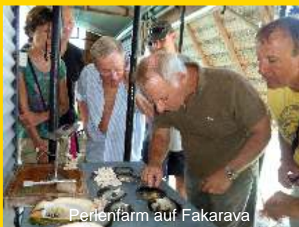
Perlenfarm auf Fakarava