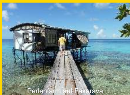
Perlenfarm auf Fakarava

Am Morgen haben wir die Möglichkeit eine kleine Perlenfarm zu besuchen. Hier wird uns der Weg der Perle vom Rohling bis zur fertigen Perle gezeigt. Im Anschluss hat jeder die Gelegenheit für kleines Geld (ab 10 €) eine der berühmten Tahiti-Perlen als Andenken an unsere wundervolle Reise zu kaufen.