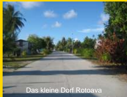
Das kleine Dorf Rotoava

Nachmittags Transfer zum Flughafen und Flug mit der Air Tahiti nach Papeete