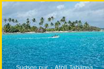
Südsee pur - Atoll Tahanea